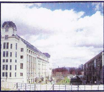
ZAC RIVE-GAUCHE : UN GRAND PROJET LANCE PAR JEAN TIBERI